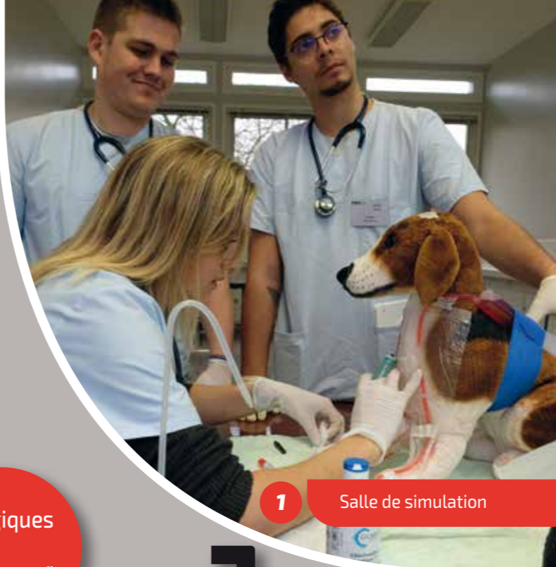
1 Salle de simulation