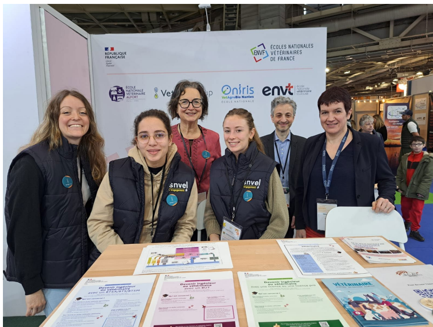
Figure 1: photo des étudiants et directeurs sur le stand des ENVF en 2025

Le public pourra également se renseigner sur :